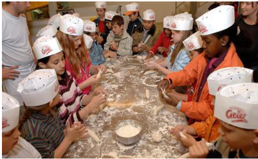
Wizyta w piekarni Geier

Większość uczniów szkoły Meissnergasse nigdy nie była gospodarstwie, a 80 procent z nich pochodzi z rodzin imigrantów. Dlatego drugim ważnym krokiem w projekcie było pokazanie im jak wygląda rolnictwo i produkcja żywności w Austrii. W szkole odbyły się warsztaty z udziałem z dietetyczki i rolniczki. Uczniowie zwiedzili gospodarstwo, które zaopatruje szkołę w warzywa i owoce, a także piekarnię, gdzie zobaczyli jak wypieka się bułki.