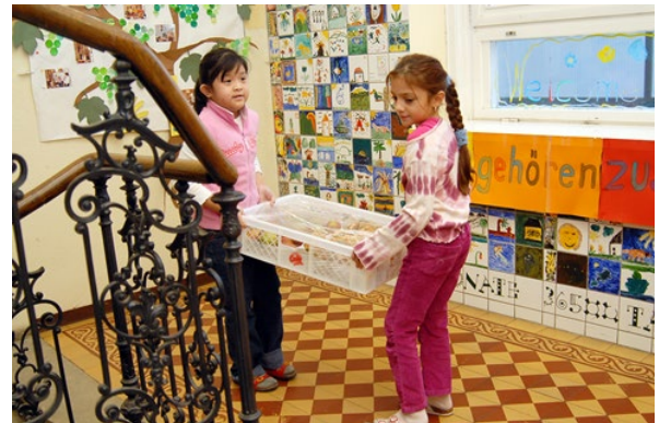
Uczennice wnoszące skrzynkę z drugimi śniadaniami